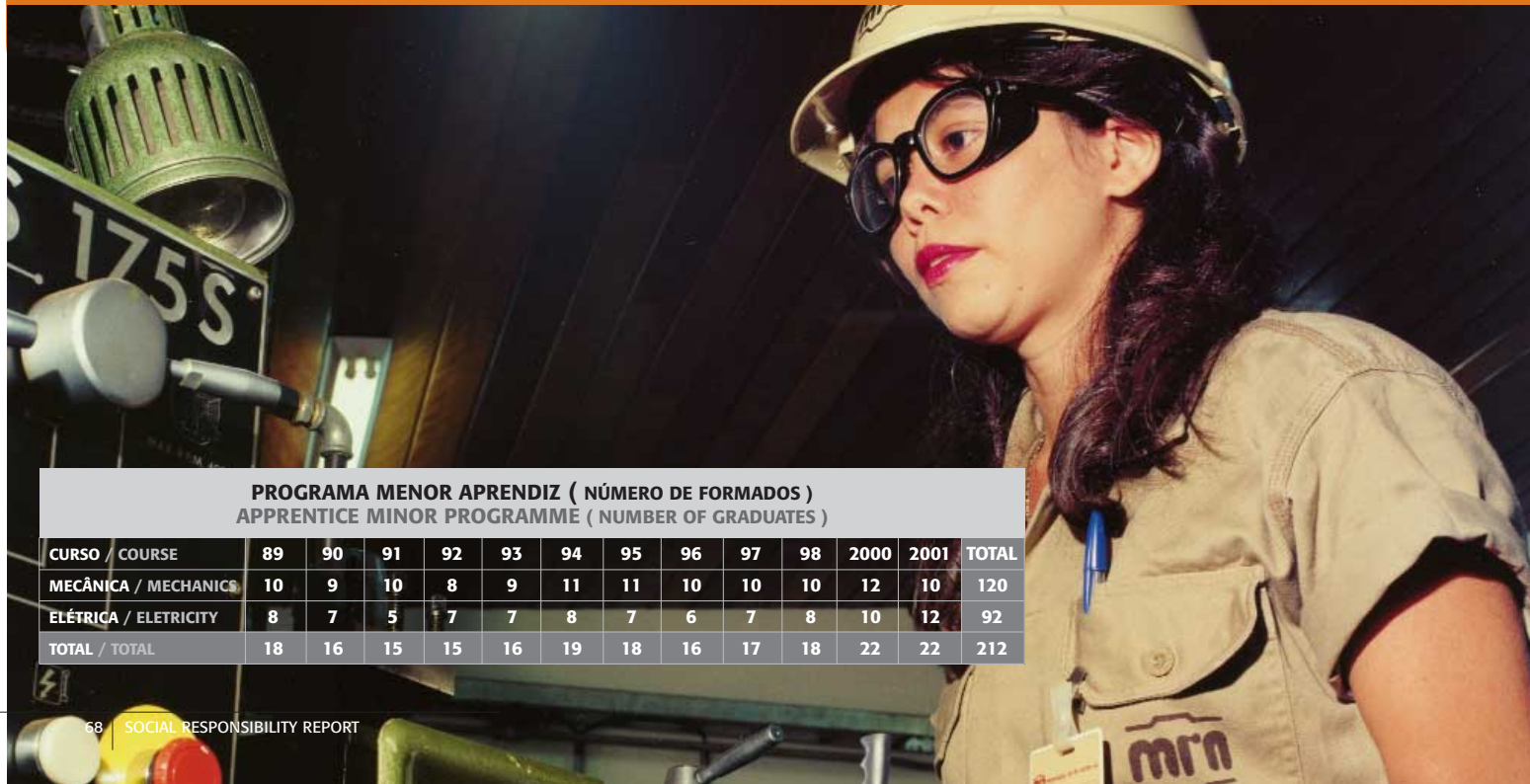
PROGRAMA MENOR APRENDIZ ( NÚMERO DE FORMADOS ) APPRENTICE MINOR PROGRAMME ( NUMBER OF GRADUATES )