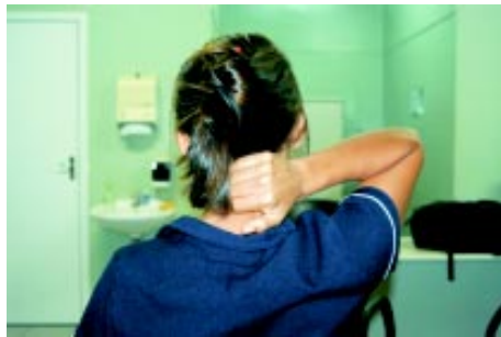
Repita este exercício três vezes

A pressão dos dedos em determinados pontos do corpo, libera hormônios, como a endorfina, e outras substâncias responsáveis pelo alívio das dores e da sensação de bem-estar. A seqüência é fundamental para garantir o relaxamento e alívio do