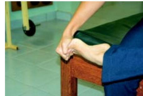
Massagem nas pernas começa pelos pés

apóie os pés no chão. Utilizando os nós dos dedos massageie no sentido do joelho para o tronco, fazendo movimentos circulares. Faça em uma perna e depois passe para a outra.